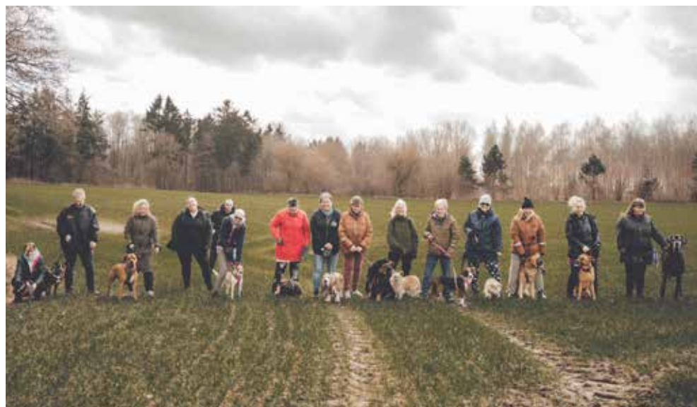
Fra venstre ses: Tiki, Zoey, Ludwig, Perle, Agnes, Hannibal, Nessa, Müsli, Alana, Teddy, Zagi, Stella og Erik.

Jeg kører derfra med en træt hund, lidt mudder på støvlerne og en rigtig god følelse i maven. Og jeg er ret sikker på, at vi deltager igen næste gang.