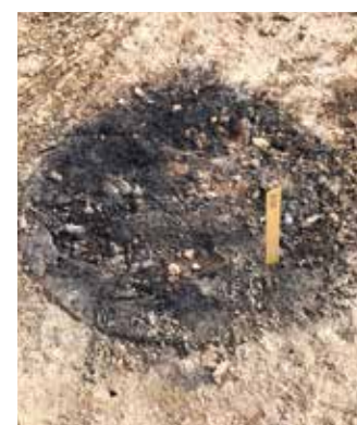
Rund kogestensgrube – sandsynligvis fra bronzealderen.