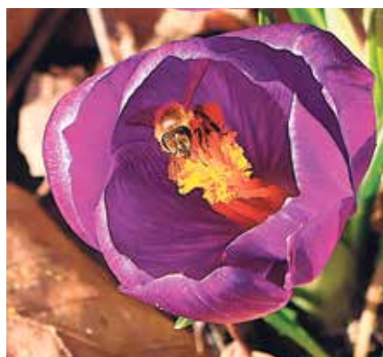
Bi og krokus.