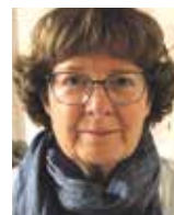
Tekst og foto: Benthe Hjorth