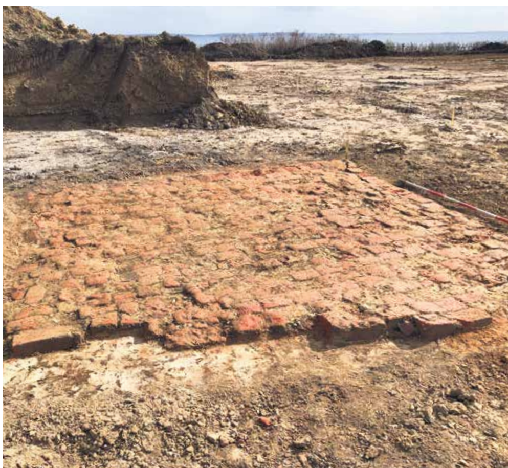
Et af de afdækkede gulve af munkesten.